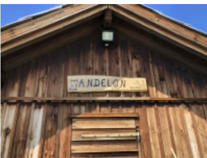
WILLKOMMEN AUF MANDELON