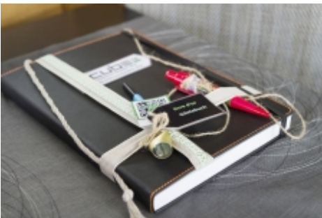
DAS GÄSTEBUCH DES CUBE