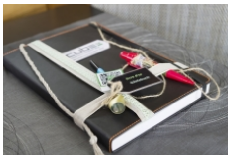
DAS GÄSTEBUCH DES CUBE